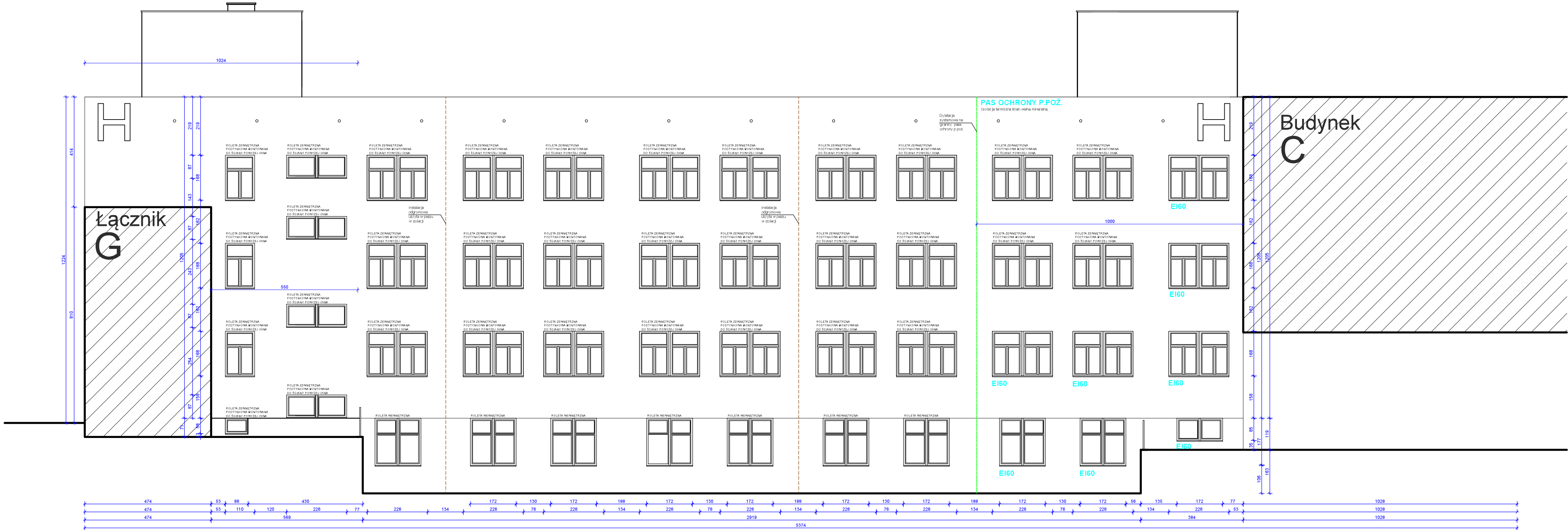
Lokalizacja oznaczenia budynku skala 1:50